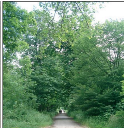
2019, vingt ans après

La tempête de 1999, en abattant les peuplements forestiers anciens, a permis de procéder à un fort rajeunissement des massifs .