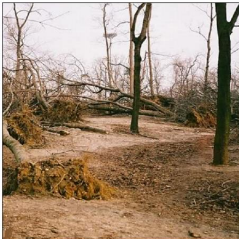
1999, après la tempête

Chacun se souvient des ravages de la tempête de 1999 qui avait affecté 250 hectares sur les 500 boisés. Après régénération naturelle ou replantation, c'est aujourd'hui un Bois de Vincennes rajeuni et mieux adapté aux futurs épisodes climatiques extrêmes qui est offert aux Parisiens.