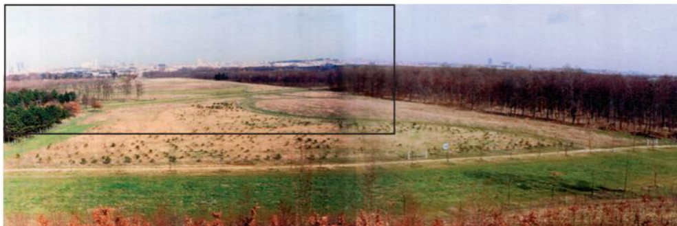
Perspective depuis la Butte aux Canons avant travaux (1991)

Le Bois de Vincennes porte la trace d'une longue occupation militaire. Au XX e siècle, de réelles améliorations ont été apportées en application des différents schémas de remise en valeur du Bois de Vincennes mis en œuvre à partir de la fin des années soixante. Ainsi, un massif forestier a été créé sur les emprises libérées par les militaires au cœur du Bois, en particulier dans le secteur de la Butte aux Canons.