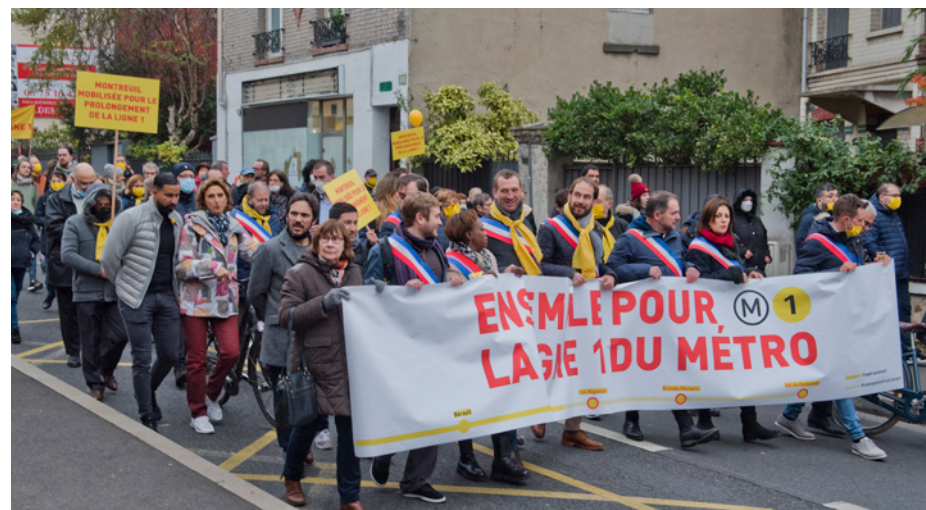
Manifestation en faveur du prolongement de la ligne 1 du métro, le 20 novembre.

La ligne 1 sera connectée au tram T1 et au RER