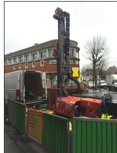
Photographie du 4 mars 2016 : Sondages aux abords du carrefour de Verdun à Fontenay-sous-Bois

→ Les rendus de ces études viendront alimenter l'analyse multicritères permettant d'effectuer le choix d'un seul tracé et d'engager la réalisation du schéma de principe et du dossier d'enquête publique suivant un seul scénario.