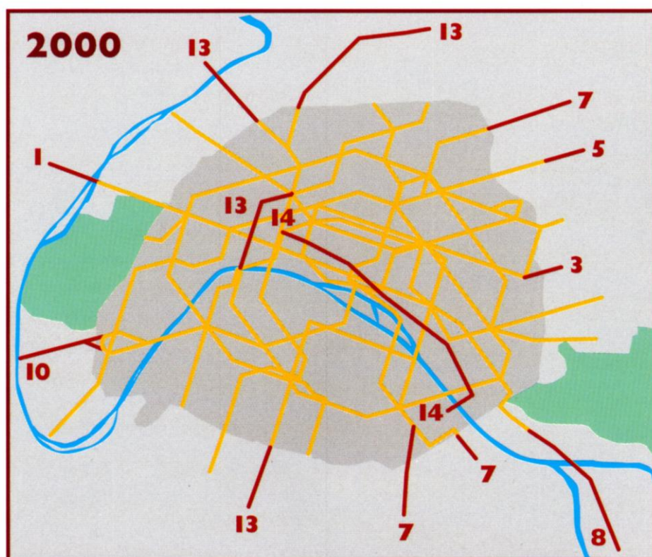
Le réseau en 2000 (en rouge, tronçons ouverts entre 1945 et 2000).

Les projets de transport dans l'Est parisien : « on a creusé, on creuse et on creusera »